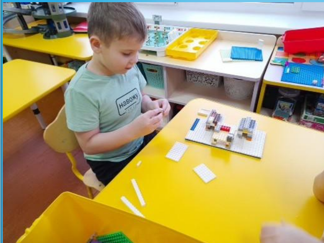
Макет «Станция полярников»